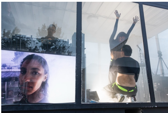
Beyond Consent - R3LN4CHT/ OhJ/ Likeminds/ Motel Mozaïque