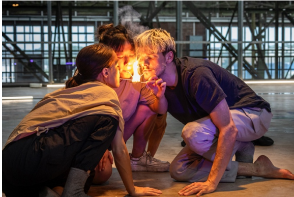
Person Longing to be Human Charles Pas/ OhIJ/ Likeminds/ Feikes Huis

“Het Zeecontainerprogramma van Over het IJ Festival is uit de stalen verpakking gehaald (‘unboxed’), waardoor de korte voorstellingen van nieuwe makers nu veelal in de publieke ruimte plaatsvinden. Dat betekent dat het voorbijrijdend (en -varend) verkeer automatisch onderdeel van de voorstelling wordt. Of dat iemand in een verstild tafereel op het plein verderop het volume van zijn boxen eens flink omhoog draait.” Sander Jansens, Theaterkrant